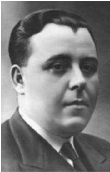
4. Rafael Calbo Cuadrado. Diputado por el Frente Popular.

Es cierto que en este tiempo se vivió un éxtasis de la izquierda gaditana, y se intentaron llevar a cabo medidas algo extremistas que afectaron sobre todo a la Iglesia Católica a la que se culpaba en gran medida de ser cómplice de los problemas sociales que tenía la ciudad de Cádiz y que culminaron en una serie de sucesos acaecidos el 8 de marzo con la quema de algunos centros religiosos con el binomio que ya se fraguaba desde 1934 entre UGT y CNT, que fueron responsabilizados por los actos, aunque algunas teorías sostienen que no llegaron a ser los únicos culpables y que fuerzas derechistas alentaron a la masa a cometer los ataques contra iglesias.