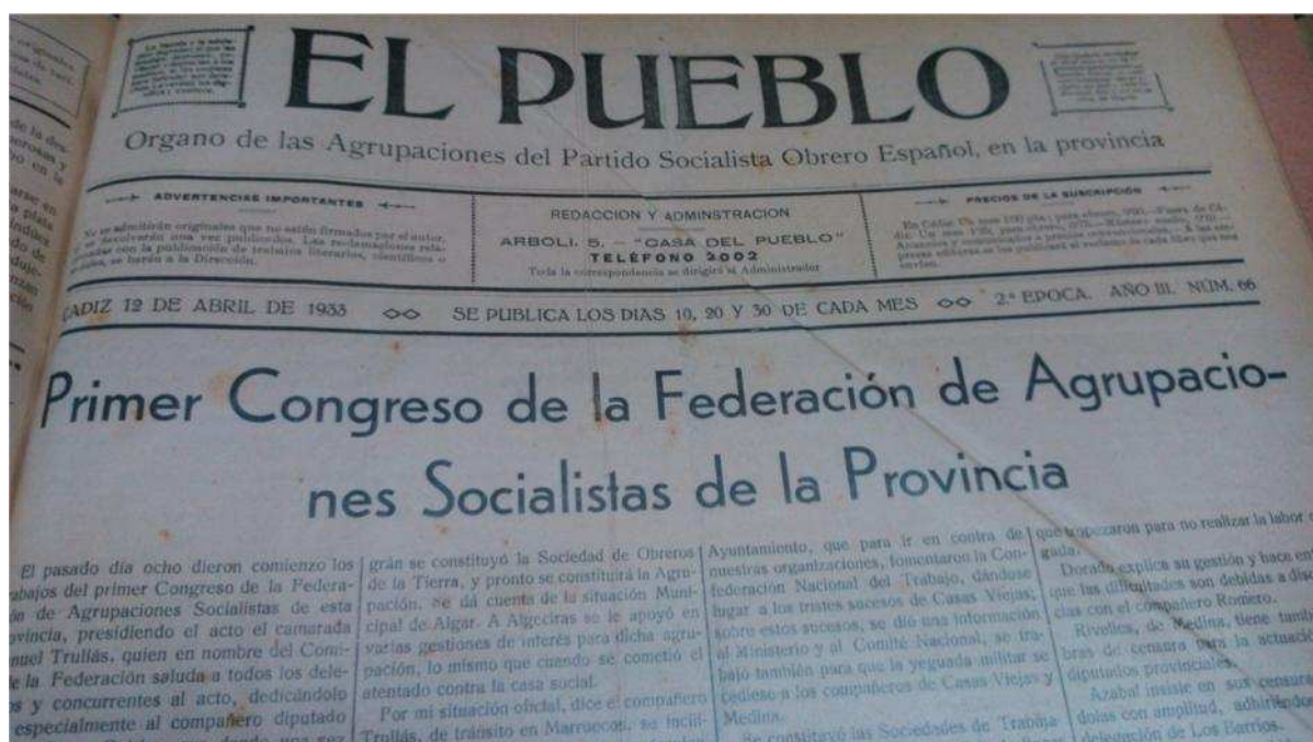
3 Portada de El Pueblo. 12 de Abril de 1933.

Punto y aparte será la creación de la Federación Provincial de Agrupaciones Socialistas, también en la capital, desde donde se articulará el funcionamiento de las Agrupaciones Socialistas de la provincia y cuyo proceso también es estudiado en detalle.