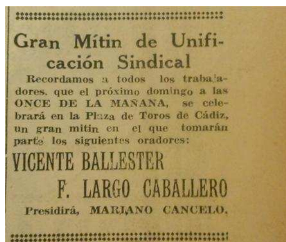
6. Cartel del Mitin en Diario de Cádiz.

las teorías revolucionarias socialistas, Francisco Largo Caballero. Ese mismo día se celebraría también en la plaza de toros de Cádiz un mitin para la Unificación oficial de las Juventudes Socialistas y Comunistas. A ambos actos acudiría gran cantidad de afiliados socialistas, de UGT y cenetistas de toda la provincia de Cádiz.